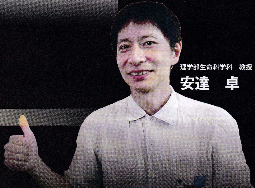
理学部生命科学科 教授