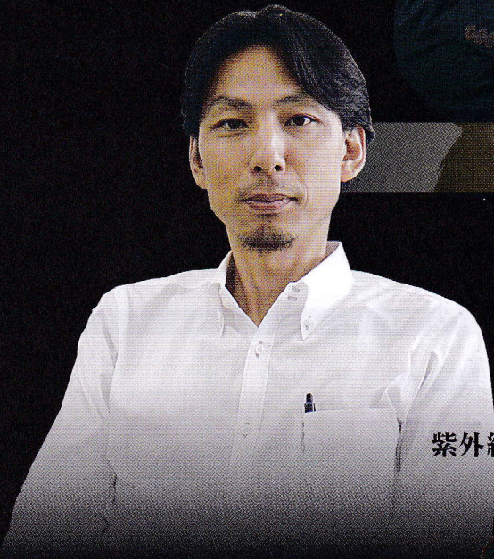
理学部生命科学科 教授