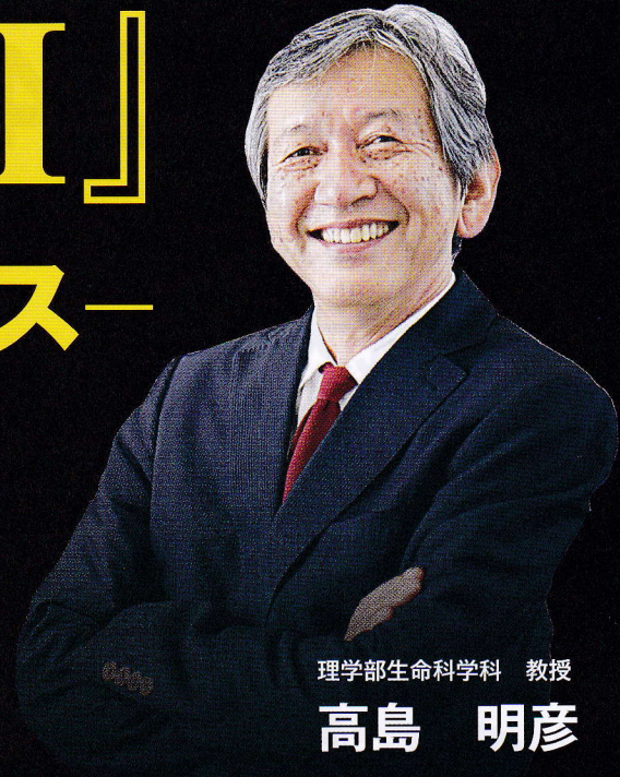
理学部生命科学科 教授